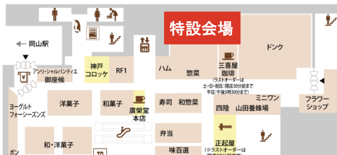
(岡山高島屋 地下1階フロアマップ (一部抜粋))