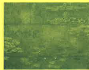
モネ《睡蓮》:大原美術館所蔵