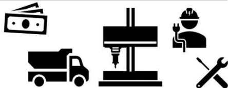
機械装置の購入・改良・据付